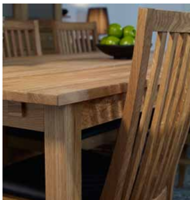
eller rak kant?